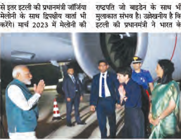
भारत यात्रा के बाद प्रधानमंत्री मोदी की दूसरी बैठक होगी। मोदी उच्चस्तरीय प्रतिनिधिमंडल के साथ इटली पहुंचे हैं। इसके साथ ही प्रधानमंत्री मोदी की अमेरिकी राष्ट्रपति जो बाइडेन के साथ भी मुलाकात संभव है। उल्लेखनीय है कि इटली की प्रधानमंत्री ने भारत के

एजेंसी रोम। प्रधानमंत्री जियोर्जिया मेलेनी के निमंत्रण पर भारत के प्रधानमंत्री नरेन्द्र मोदी इटली पहुंच गए हैं। वो जी-7 आउटरीच शिखर सम्मेलन में हिस्सा लेंगे। इस सम्मेलन का आयोजन इटली के अपुलीया क्षेत्र किया गया है। प्रधानमंत्री मोदी का इटली पहुंचने पर जोरदार स्वागत किया गया। प्रधानमंत्री नरेन्द्र मोदी ने इटली पहुंचने पर एक्स हैडल पर अपने विचार व्यक्त करते हुए कुछ फोटो भी साझा किए हैं। उन्होंने कहा है, ' विश्व नेताओं के साथ सार्थक चर्चा में शामिल होने के लिए उत्सुक हूं। साथ मिलकर, हमारा लक्ष्य वैश्विक चुनौतियों का समाधान करना और उच्चल भविष्य के लिए अंतरराष्ट्रीय सहयोग को बढ़ावा देना है।' भारत के प्रधानमंत्री नरेन्द्र मोदी इस सम्मेलन