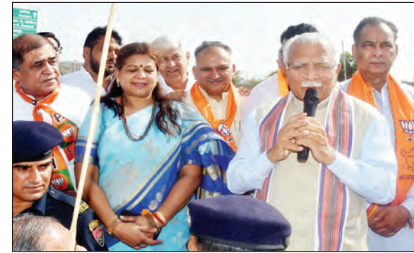
की सरकार बनाने का समय है। तीन माह बाद विधानसभा के चुनाव होने हैं और हमें विपक्ष द्वारा जो-जो गलत धारणाएं आम जनता में फैलाई गई हैं उनको आम जनता के बीच जाकर दूर करना है। उन्होंने कहा कि केंद्र में प्रधानमंत्री नरेंद्र मोदी के नेतृत्व में बिजली, पानी, सड़क, गैस सिलेंडर, औद्योगिक विकास सहित अनेकों विकास कार्यों को पूर्ण कर तीसरी बार सरकार बनी है। वहीं विपक्ष द्वारा गलत व ओछे हथकंडे अपनाकर

केंद्रीय उर्जा, आवास एवं शहरी विकास मंत्री मनोहर लाल ने कहा कि केंद्र में तीसरी बार प्रधानमंत्री नरेंद्र मोदी के नेतृत्व में सरकार बनी है। 1962 के बाद यह पहली बार है कि जब कोई व्यक्ति लगातार तीसरी बार प्रधानमंत्री बना है। उन्होंने कहा कि केंद्र की सरकार में हरियाणा से तीन मंत्री बने हैं और इससे हरियाणा के विकास को गति मिलेगी। उन्होंने कहा कि प्रदेश में विकास की नई योजनाएं शुरू होंगी और केंद्र सरकार के सहयोग के साथ प्रदेश विकास के नए कीर्तिमान स्थापित करेगा। मनोहर लाल शुक्रवार को केंद्रीय मंत्री बनने के बाद पहली बार हरियाणा पहुंचे और उनका सोनीपत के कुंडली, सेक्टर-7 और गनौर में भाजपा कार्यकर्ताओं द्वारा भव्य स्वागत किया गया। केंद्रीय मंत्री मनोहर लाल ने कहा कि आनंद केंद्र में तीसरी बार भाजपा की सरकार बनने के बाद हरियाणा प्रदेश में तीसरी बार भाजपा