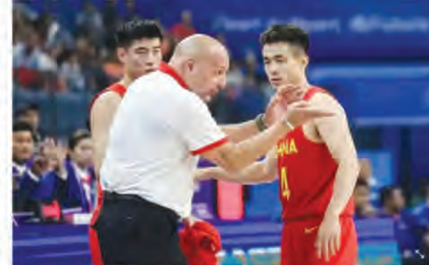
एशियाई खेलों की चैम्पियनशिप का बचाव करने की उनकी योजना विफल रही और टीम को

एजेंसी बीजिंग। चीनी बास्केटबॉल एसोसिएशन (सीबीए) ने कोच अलेक्जेंडर जोर्डेजविक के साथ अपना करार खत्म कर दिया है। सीबीए ने जोर्डेजविक की जगह गुओ शिकियांग को चीन की पुरुष बास्केटबॉल टीम का कार्यवाहक मुख्य कोच नियुक्त किया है। जोर्डेजविक ने नवंबर 2022 में डू फेंग की जगह ली और हांगकांग, चीन में 2023 फीबा बास्केटबॉल विश्व कप एशियाई क्वालीफायर की छठी विंडो के दौरान चीन के मुख्य कोच के रूप में अपनी शुरुआत की। सर्बिया के मूल निवासी जोर्डेजविक ने चीन को फीबा विश्व कप में पहुंचाया, लेकिन टीम मनीला में निराशाजनक 29वें स्थान पर रही और पेरिस 2024 ओलंपिक खेलों के लिए क्वालीफाई करने में विफल रही। जोर्डेजविक की टीम को हांगजो में एक और झटका लगा जब सेमीफाइनल में हार का सामना करना पड़ा। प्रमुख प्रतियोगिताओं में चीन की लगातार विफलताओं के कारण कार्य और चीनी पुरुष बास्केटबॉल टीम का वास्तविक प्रतियोगिता आवश्यकाताओं के आधार पर, सीबीए ने जोर्डेजविक और उनके दल के साथ अपने मौजूदा सहयोग को समाप्त कर दिया है। जोर्डेजविक ने सोशल मीडिया पर चीनी बास्केटबॉल को अलविदा कहते हुए कहा, चीनी महासंघ और उन खूबसूरत लोगों के प्रति मेरी हार्दिक कृतज्ञता, जिनसे मैंने मिली और जिनके साथ काम किया। मैं कोचों, याओ मिंग और उनकी टीम और निश्चित रूप से टीम और खिलाड़ियों को शुभकामनाएं देता हूँ। टीम चीन आगे बढ़े - तुम्हारा सचिव्याई भाई तुम्हारा समर्थन करेगा! चीन इस प्रयोग में 10 से अधिक मैत्रीपूर्ण मैच खेलेगा, जिसमें 5 से 10 जुलाई तक सैक्रामेंटो में होने वाली एनबीए समर लीग भी शामिल है।