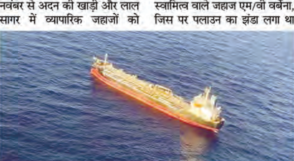
स्वामित्व वाले जहाज एम/वी वर्वेना, जिस पर पलाउन का झंडा लगा था

एजेंसी वाशिंगटन। इस्लाम-हमास युद्ध शुरू होने के बाद यमन के हूती विद्रोही जहाजों को निशाना बना रहे हैं। अमेरिका, ब्रिटेन समेत कई देश खुले शब्दों में चेतावनी दे चुके हैं, लेकिन हूती अपनी हरकत से बाज नहीं आ रहे हैं। एक बार फिर विद्रोहियों ने अदन की खाड़ी में दो कूरुज मिसाइलों से हमला कर एक मालवाहक जहाज को क्षतिग्रस्त कर दिया। इस हमले में एक नाविक गंभीर रूप से घायल हो गया। हालांकि, अमेरिकी सेना ने उसे सुरक्षित बचा लिया। इसलिए कर रहे हमले बता दें, गाजा में हो रहे इस्लाम हमलों से मध्यपूर्व बौखलाया हुआ है। मध्यपूर्व गाजा में हो रहे हमलों का कारण अमेरिका को मानता है। इसी वजह से हूती विद्रोही पिछले साल नवंबर से अदन की खाड़ी और लाल सागर में व्यापारिक जहाजों को